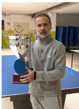
Torneo tennis tavolo "play for fun"

Vincitore torneo tennis tavolo "play for fun" per docenti e non.