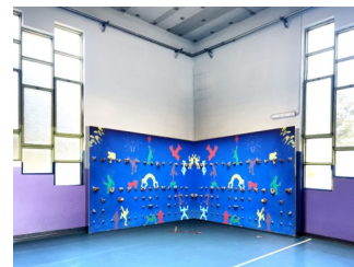
La palestra piccola potrebbe rinnovarsi?

Fantasia o realtà? Nei pensieri degli insegnanti di scienze motorie c'è anche questo. Quanto sarebbe bello avere una piccola e sicura parete di arrampicata? Sperando in una burocrazia veloce e un costo moderato ci proveranno sicuramente.