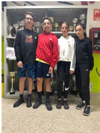
Team Britannia F

Quest'anno anche a Nichelino si è regatato nella manifestazione più antica del mondo l'America's Cup.