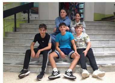
Team Britannia E