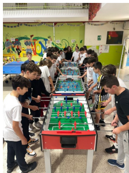
Torneo studenti calcio balilla

Grazie al molto materiale che questa scuola possiede è possibile anche questo.